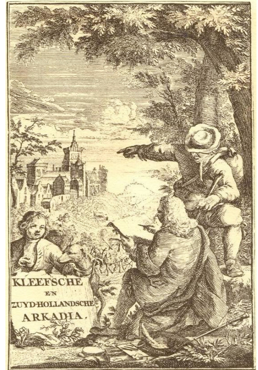
Blick vom Papenberg auf das Schloss zu Kleve

Pieter Post und Jacob van Campen, berühmte niederländische Architekten aus Den Haag und Amsterdam, entwarfen Pläne für eine großzügige Landschafts- und Parkgestaltung rund um Kleve. Sie gilt bis heute „als frühes Beispiel einer gezielten, großflächigen Landschaftsgestaltung des 17. Jh. durch Fürst Johann Moritz von Nassau-Siegen – wichtig für die Geschichte der europäischen Gartenkunst“!